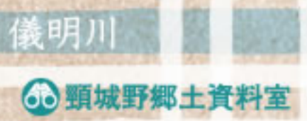
頸城野郷土資料室