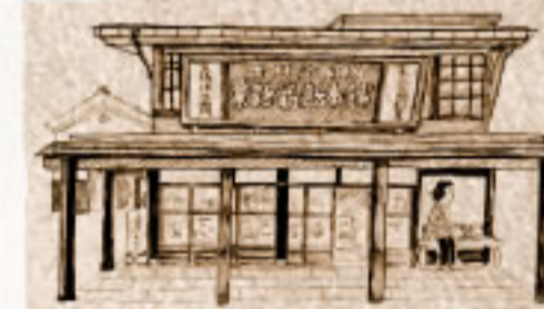
旧師団長官舎 (入場無料)