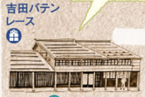
吉田バテンレース