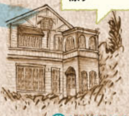
旧師団長官舎 (入場無料)